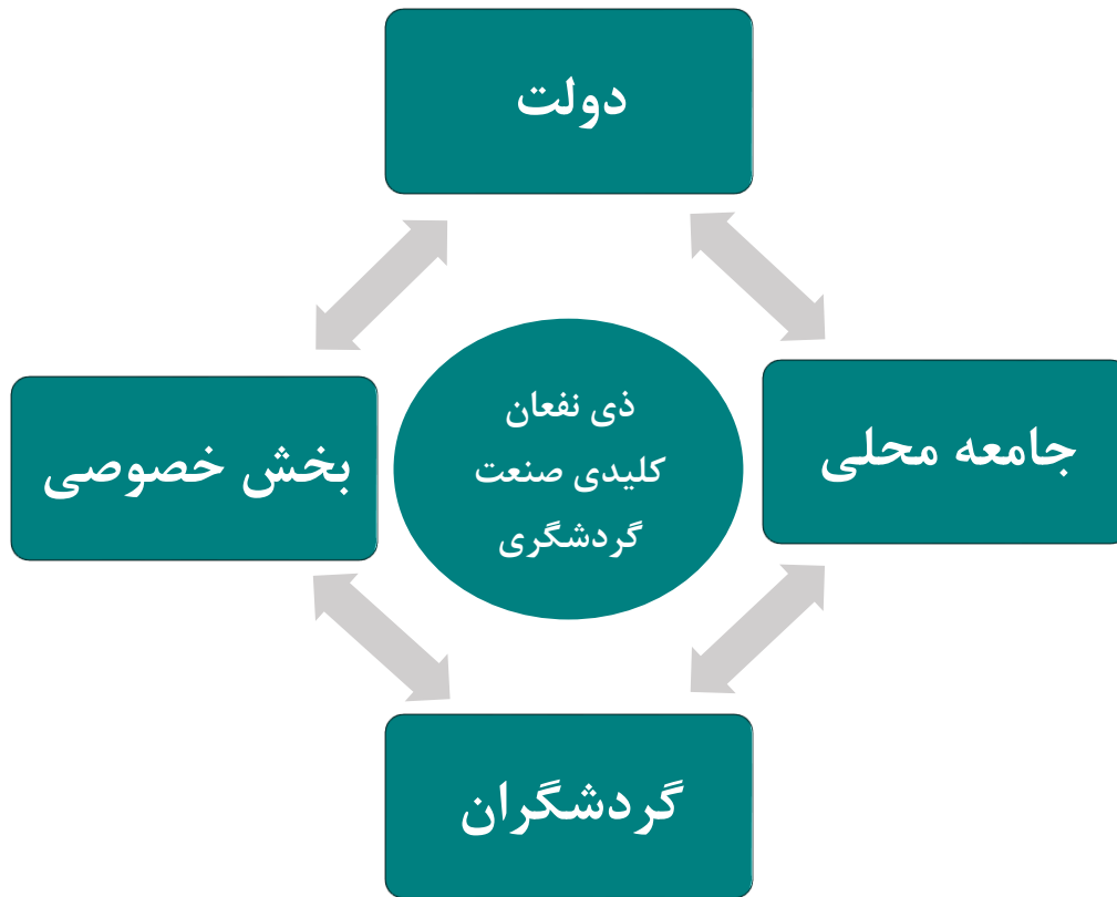
نمودار ذی نفعان کلیدی صنعت گردشگری کشور

توسعه هدفمند گردشگری در کشور نیازمند مشارکت ذی نفعان کلیدی است. ذی نفعان، افراد و گروه هایی هستند که برای رسیدن به بخشی از اهداف یا نیازهای خود به صنعت گردشگری وابسته اند و صنعت گردشگری نیز به نوبه خود برای رشد پایدار به آنها وابسته است. ذینفعان صنعت گردشگری گروه یا افرادی هستند که می توانند بر فعالیت های آن تأثیر بگذارند و یا از آن تأثیر بپذیرند. لذا همکاری و مشارکت ذی نفعان و توجه به خواسته ها و منافع آن ها در چارچوب رویکرد توسعه پایدار، در برنامه ریزی، اجرا و نظارت بر توسعه صنعت گردشگری اهمیت دارد. ذی نفعان کلیدی بخش گردشگری را می توان در چهار گروه اصلی دولت، جامعه محلی، گردشگران و بخش خصوصی دسته بندی نمود.